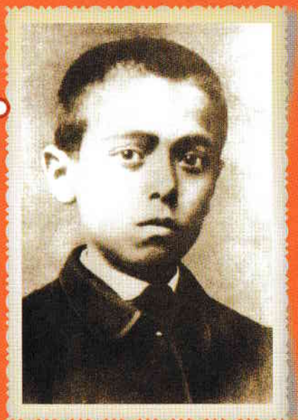
Caragiale la 8 ani, în 1860